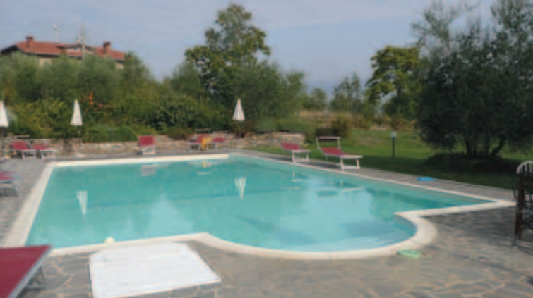
Villa Poggio har alle faciliteter, dejlige værelser og en skøn swimmingpool.