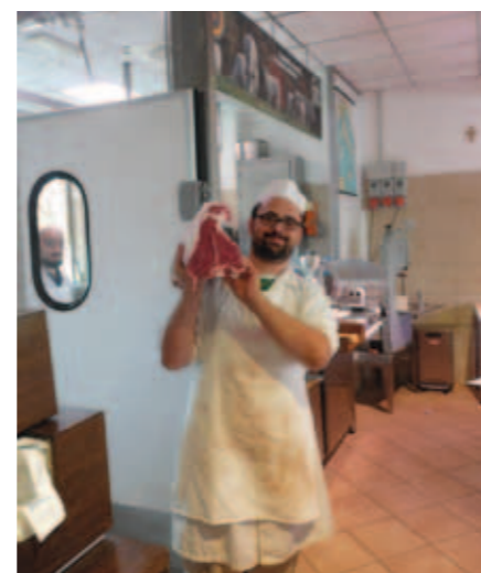
Slagteren hos Belli.